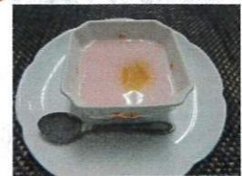
ババロア(ストロベリー)