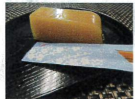
手作り羊羹(白あん)