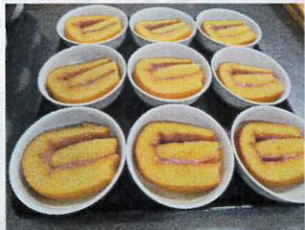
手作り台湾カステラ(いちごミルク)