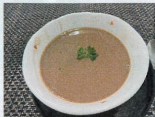
手作りババロア(チョコ)