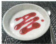
ババロア(ヨーグルト)