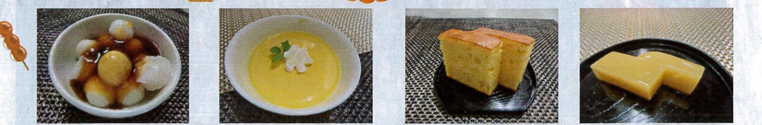
十五夜にみたらし団子