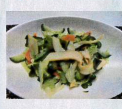
いかの燻製サラダ