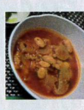
大豆と挽肉のトマト煮